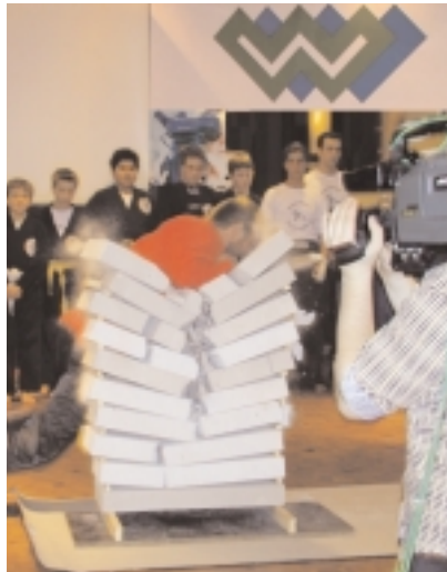
Im nächsten Jahr wird WW-TV verstärkt Unterhaltungssendungen anbieten. Das Foto zeigt einen Programmpunkt der diesjährigen Sportlerwahl.

Neue Sendungen haben bereits in den letz-