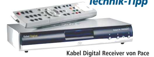
Kabel Digital Receiver von Pace

oder wie schließt man einen Kabel-Receiver an, um zusätzliche Hörfunk- und Fernsehprogramme des Kabel-TV-Anschlusses in digitaler Ton und Bildqualität nutzen zu können?